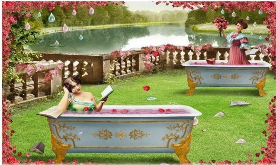
Les bains lacrymaux de Baden-Blumen. Très en vogue au XIX e siècle, les cures de romans à l'eau de rose.